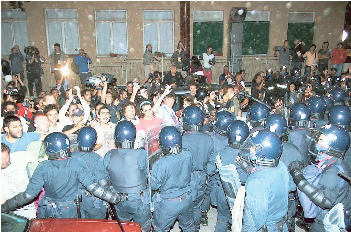
Gli agenti in tenuta anti-sommossa fermano i no global che protestano davanti alla Diaz durante l'irruzione

«Era un corteo di allegria e speranza, molto variegato con ambientalisti, pacifisti da tutto il mondo e compagni di tutti i colori. Pensavamo di portare a casa ore di immagini di un serpentone di festa e felicità, poi si sono infiltrati i